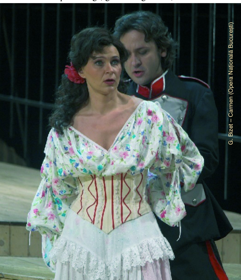
G. Bizet – Carmen (Opera Națională București)

Interpreții de operă trebuie să învețe să-și amplifice vocea folosindu-și corpul drept „cutie de rezonanță” potrivit unor specialiști, oasele cutiei toracice amplifică sunetele mai grave, pe când maxilarul inferior și oasele cavităților