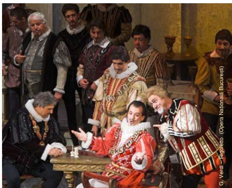
G. Verdi – Rigoletto (Opera Națională București)