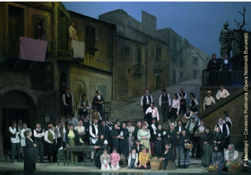
P. Mascagni – Cavaleria Rusticana (Opera Națională București)