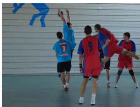
Tabela de marcaj arăta scorul de 25-22...scor care astăzi a demonstrat că dacă vrei, poți...că dacă ai ambiție și profesionalism...și poate și un dram de noroc...poți obține maximum posibil!